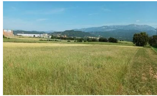
Imatge 1: Parcel·les experimentals del projecte SUSFORAGE.

Dins del context català, el grup ECOFUN ha elaborat dos projectes diferents amb mescles de farratges amb resultats prometedors. El primer, dins de la xarxa internacional experimental LegacyNet, buscava investigar les millors mescles possibles en sistemes de rotació de cultius mentre que el projecte SUSFORAGE cerca trobar quina és la millor combinació de farratge en diferents punts de la conca mediterrània i els beneficis que pot aportar unit a un sistema de pasturatge directe.